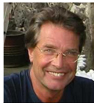
Teun A. van Dijk