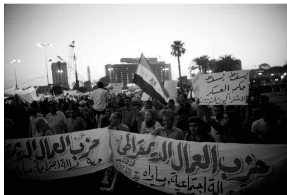
Manifestaciones en Egipto: un lenguaje autoreferencial

"En más de tres siglos de ciencia todo ha cambiado excepto tal vez una cosa: el amor por lo simple. Desde que Galileo, Descartes y Newton inventaran la física, simples han sido los objetos descritos por la ciencia, muy simples las leyes para describirla y simplísimas sus expresiones matemáticas. De tal simplicidad se deduce buena parte de su prestigio: rigor, universalidad, incluso belleza (...)" 23