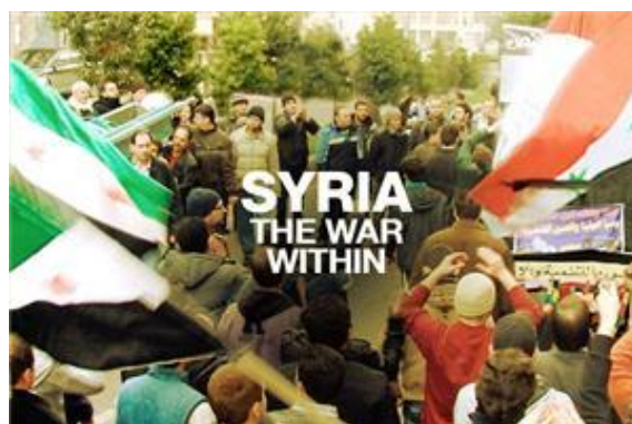
El 'reconocimiento' de Palestina como Estado miembro en la ONU. Manifestaciones opositoras a Putin (ПУТИН). Las incógnitas sobre Siria.