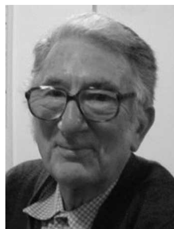
Michel A. K. Halliday

Para seguir esta lectura, debemos percibir que el lenguaje sólo surge a la existencia cuando funciona en algún contexto. No experimentamos el lenguaje en