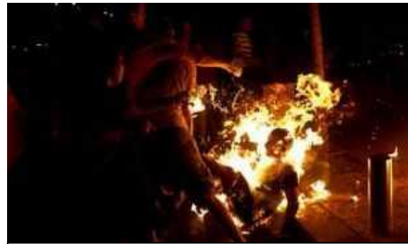
La inmolación del activista israelí Moshe Silman. ¿Cuáles son los 'presupuestos' de la semiótica política de esta acción?

comunicación con la difusión de la ideología. Esta ruta reflexiva es determinante si nos interesa, de algún modo u otro, delimitar el alcance de la noción 'verdad' que transportan los enunciados que difunden creencias, valores e inducen a comportamientos de grupos que pugnan por el control de un espacio de competencia comunicativa. Es decir, discurso (enunciaciones ideológicas), orden (enunciaciones ideológicas jerarquizadas) y poder (enunciaciones ideológicas jerarquizadas imperativamente), se encuentran vinculados como ya veremos cuando analicemos en el Seminario las 'paradojas' en este principio de siglo XXI.