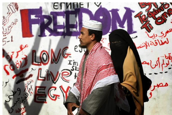
Términos designativos en contexto. La universalidad del registro contestatario

receptores pasivos en su relación con los textos; e) Existen semejanzas entre el lenguaje de la ciencia y el lenguaje de las instituciones 46 .