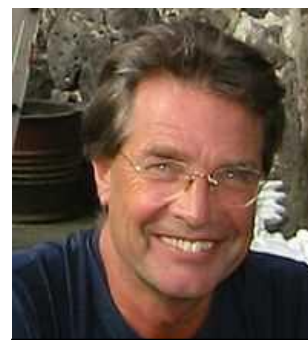
Teun A. van Dijk