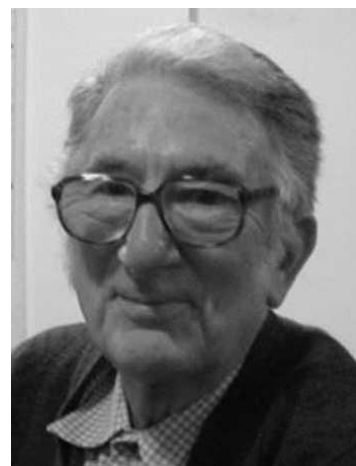
Michel A. K. Halliday

Para seguir esta lectura, debemos percibir que el lenguaje sólo surge a la existencia cuando funciona en algún contexto. No experimentamos el lenguaje en