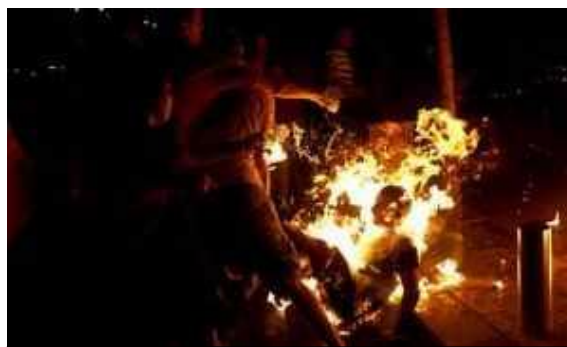
La inmolación del activista israelí Moshe Silman. ¿Cuáles son los 'presupuestos' de la semiótica política de esta acción?

comunicación con la difusión de la ideología. Esta ruta reflexiva es determinante si nos interesa, de algún modo u otro, delimitar el alcance de la noción 'verdad' que transportan los enunciados que difunden creencias, valores e inducen a comportamientos de grupos que pugnan por el control de un espacio de competencia comunicativa. Es decir, discurso (enunciaciones ideológicas), orden (enunciaciones ideológicas jerarquizadas) y poder (enunciaciones ideológicas jerarquizadas imperativamente), se encuentran vinculados como ya veremos cuando analicemos en el Seminario las 'paradojas' en este principio de siglo XXI.