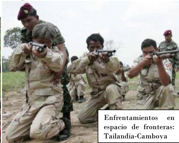
Enfrentamientos en espacio de fronteras: Tailandia-Camboya