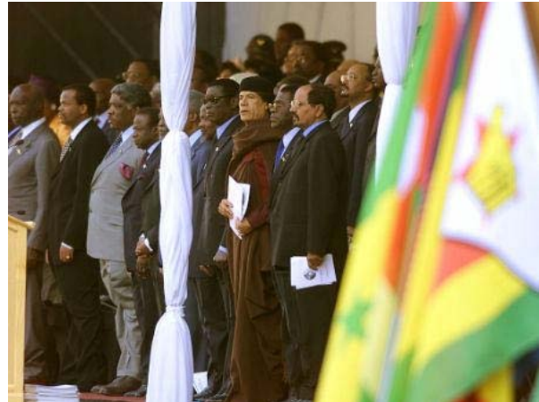
Los líderes africanos asisten a la ceremonia de apertura de la Unión Africana, en el estadio de Durbán, el 9 de julio del 2002. Africa celebró el martes la creación de la unión continental para tratar de poner fin a la pobreza y la guerra, comprometiéndose a aplicar un programa de gobierno transparente que acabe con los abusos de los derechos humanos y atraiga la inversión extranjera. (Martes 9 de julio, 2001)

BRUSELAS Copyright 2003 The Associated Press.(...) Los embajadores de la Unión Europea en Bruselas aprobaron el plan cinco días después de que el Consejo de Seguridad de las Naciones Unidas autorizó una fuerza multinacional de 1.400 miembros. El anuncio se produce cuando los europeos buscan incrementar su influencia en el escenario internacional y actuar a una sola voz, especialmente ante la mirada de Washington. "Esto es algo políticamente muy importante", dijo Javier Solana, representante de política exterior de la UE. "Demuestra que la Unión Europea tiene la voluntad para actuar", expresó. Solana dijo que comenzó a organizar la fuerza después de que el secretario general de las Naciones Unidas, Kofi Annan, lo llamó y le preguntó si la UE podía iniciar una