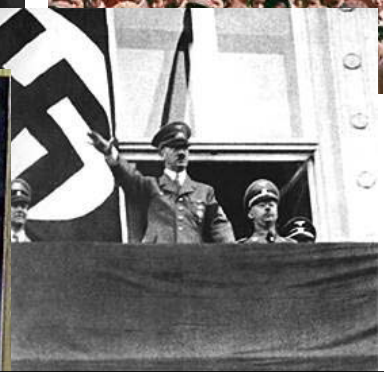
Pierre J Proudhon, Kart Marx, M. Gandhi, Mao, Mussolini y Hitler.