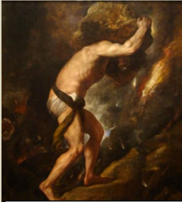
Sísifo (Tiziano, Museo del rado, 1548/9)