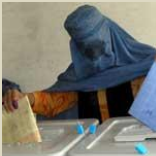
El vocabulario clave y las nuevas representaciones del comportamiento humano. Compleja conceptualización del voto en entornos interculturales bajo diálogo imperativo.

conocimiento, la filosofía del lenguaje y la antropología cultural nos dan bastones necesarios - pero siempre insuficientes- para el abordaje de temas de investigación del área que involucra a las relaciones internacionales y pos/internacionales. Las palabras, en su contextualidad conceptual, nos dan una idea del cómo conocer, con una inferencia directa: establecer los resultados operativos, concretos, decisivos, en cuanto a la delimitación y selección de acontecimientos en estudio, en especial durante el proceso de organización política, social y económica/intercultural en que se ha involucrado la actividad humana. ¿Abordaremos un enfoque epistemológico dictómico, basado en la concepción heredada, en la cual el sujeto que conoce y el objeto por conocer están perfectamente diferenciados? ¿Acaso no debemos tomar en cuenta la diferencia entre lo dicotómico y el reflectivismo, entre la “simplicidad organizada” y la complejidad no organizada”? Es decir, “¿Qué quiere decir, eso que añades?”