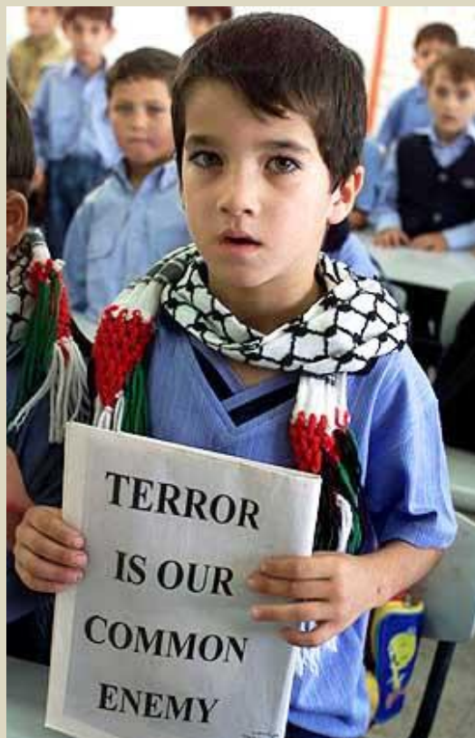
Al día siguiente del atentado del 11 de septiembre de 2001 en EE.UU., un niño palestino ofrecía este testimonio que recorrió el mundo. ¿Qué tipo de desafío lleva involucrado?

“De pronto, el cuerpo del muchacho se tensó en posición de alerta. El sonido, la visión y el olor lo habían advertido simultáneamente. tendió la mano hacia el viejo, lo tocó, y ambos permanecieron inmóviles y silenciosos. (...) entonces, un gran oso pardo se les mostró saliendo ruidosamente, y también él se detuvo instantáneamente, al ver a los dos humanos. (...) volvieron a la cima, y el muchacho dijo, con una risita prudentemente atenuada: - ¡Ése era grande, abuelo! El viejo hizo una seña afirmativa. Meneó tristemente la cabeza, y contestó, con una voz falsete parecida a la de un niño: -cada día hay más. -!Quién hubiera pensado que viviría lo bastante para ver unos tiempos en que se corre peligro de muerte por el mero hecho de circular por el territorio del balneario de Cliff-House! En la época de la que te hablo, Edwin, cuando yo era un niño, acudan aquí, en verano, decenas de miles, hombres, mujeres, niños y niñas. Y entonces no había osos por aquí, puedes estar seguro. O, al menos, eran tan escasos que se los metía en jaulas y se pagaba dinero por verlos. -